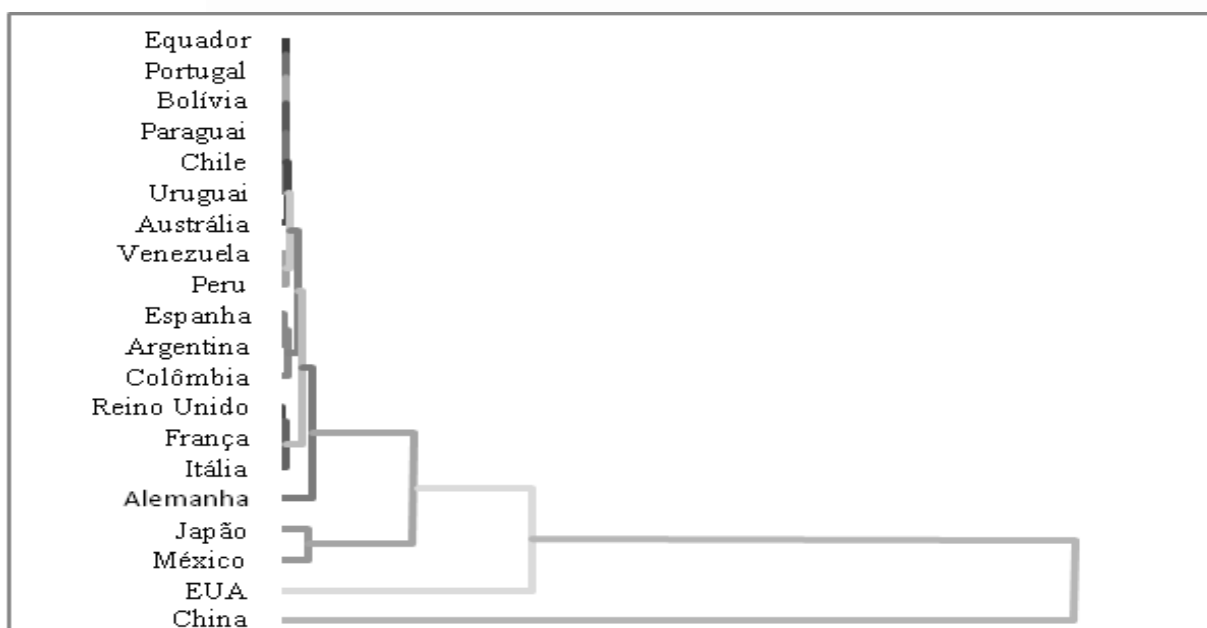
FIGURA 2. Dendograma (países emissores)

Desses grupos, observa-se que os quatro primeiros não possuem diferenças significativas entre eles, sendo todos muito próximos. Apenas nos três últimos grupos (Japão e México – EUA – China) é que se pode destacar uma diferença relevante, evidenciando que através dos dados escolhidos (PIB, POPULAÇÃO, IDH e DISTÂNCIA) não se pode separar ou explicar os fluxos turísticos de maneira consistente.