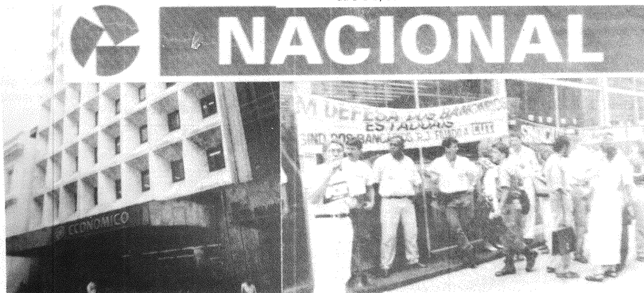
Reprodução - Montagem