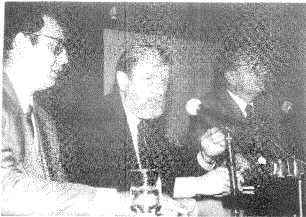
Conferência Internacional John Naisbitt