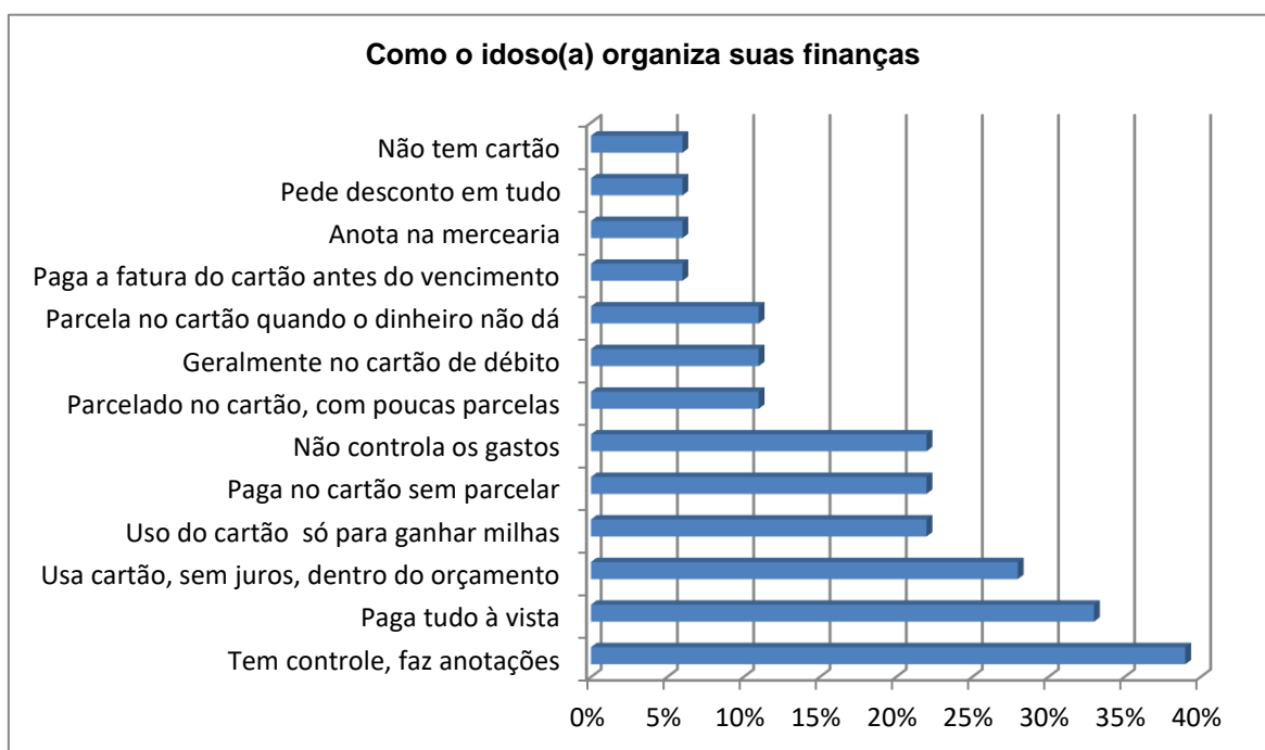
Gráfico 1 – Organização financeira dos idosos